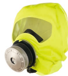
Capucha de escape Dräger PARAT® 5500

Si el filtro se cambia a los 8 años, la vida útil aumenta hasta los 16 años, lo que le permite ahorrar costes a largo plazo. Además, puede sustituir el filtro fácilmente, siguiendo unas sencillas instrucciones.