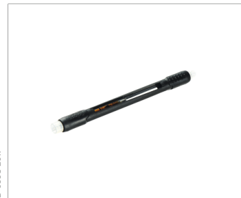
Adaptador de bomba