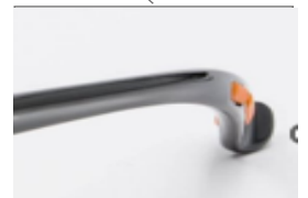
Marco y patillas flexibles de nylon.