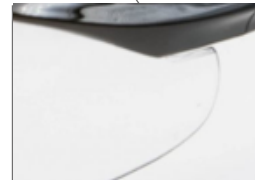
Protección lateral integrada que no obstruye la visión periférica.