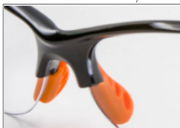
Nasales en silicona para mayor confort y ajuste.